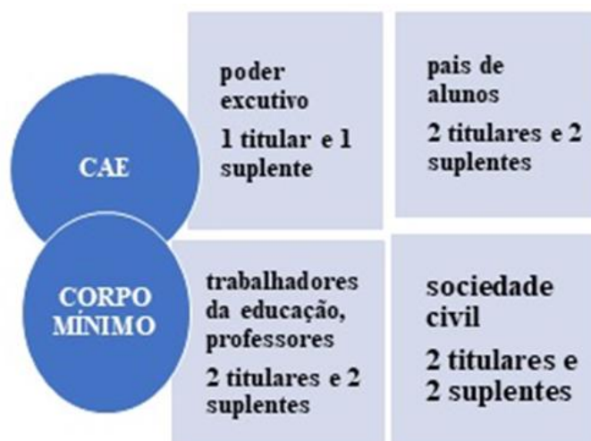
Fig. 1. Composição do CAE - Conselho de Alimentação Escolar

O CAE é composto por no mínimo 7 (sete) membros titulares e seus respectivos suplentes, representantes do Poder Executivo, trabalhadores da educação e discentes, entidades civis e pais de alunos [12]. A figura 1 sistematiza a composição do CAE.